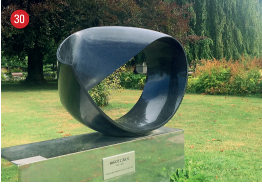
Jakob-Züllig-Park Linea del Tempo continuo · Silvio Santini · Carrara