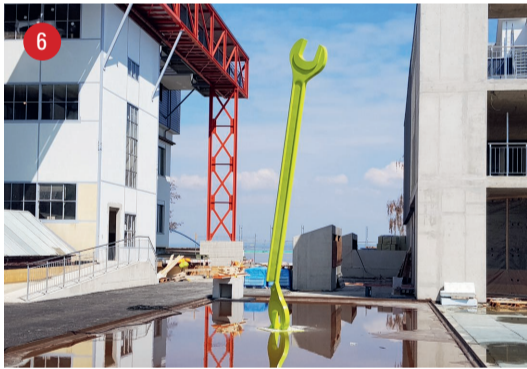
Zum See Schraubenschlüsselbruch · Marc Moser · Arbon