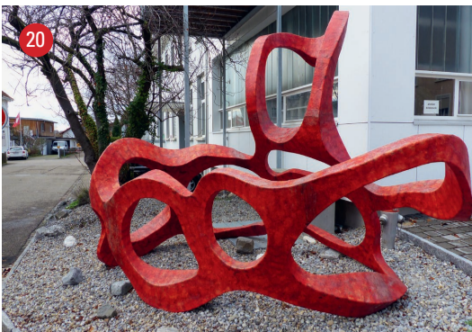
Bildstockstrasse 5 Ana · Anita Städler · Arbon