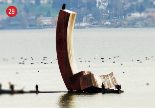
auf dem See Balance · Jörg Plikart · Hamburg