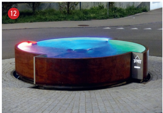
Stahelkreisel Kreiselbrunnen · Thomas Sonderegger · Arbon