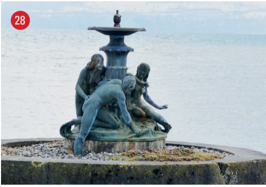
Hafenmole Nymhengruppen · August Bösch · Ebnat