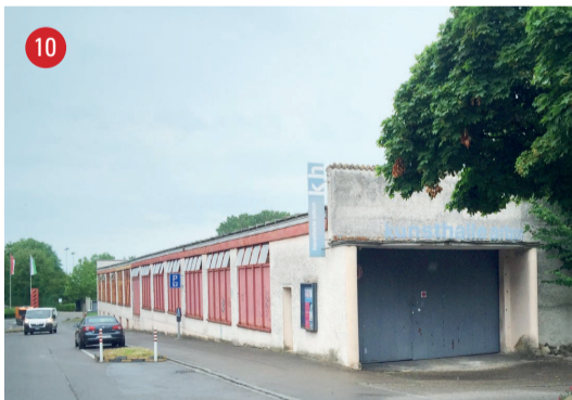
Grabenstrasse 6 Kunsthalle Arbon