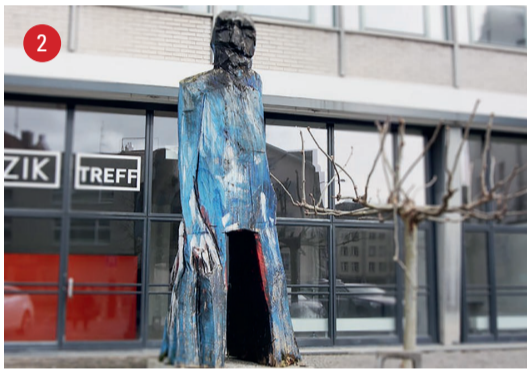
Schlossgasse Franz · Klaus Prior · Lugano