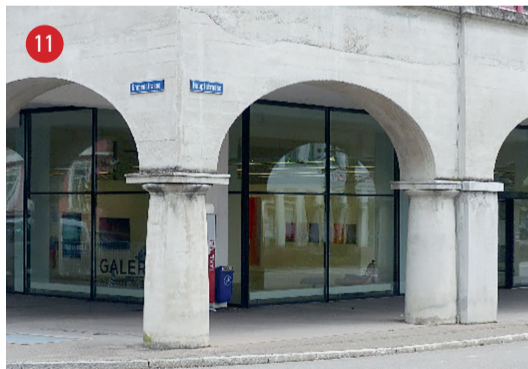
Grabenstrasse 2 Galerie Bleisch für zeitgenössische Kunst