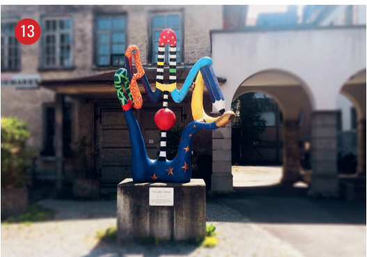
Hauptstrasse 12 Friendly Hand · Sabine Aepli-Kutter · Berg