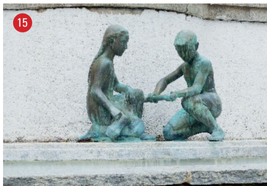
Promenadenstrasse 9 Geschwisterpaar · Ernst Heller · Eglisau