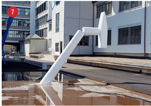
Zum See Hammerbruch · Marc Moser · Arbon