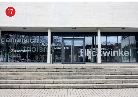
Rebenschulhaus Wortfeld · Rutishauser / Kuhn · Trogen