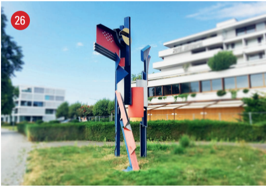
Bahnhofstrasse 49 Trilogie · Silvio Mattioli · Winterthur