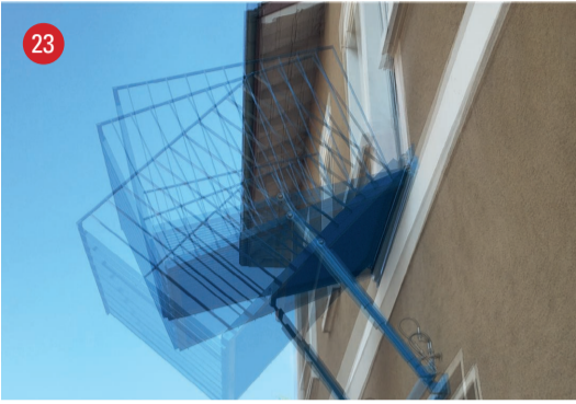
Brühlstrasse 13 Kippender Balkon · Roman Signer · St.Gallen