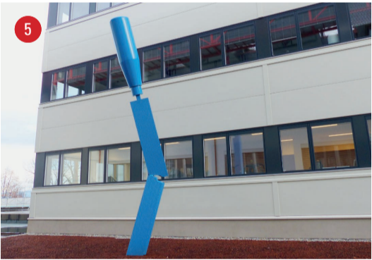
Zum See Feilenbruch · Marc Moser · Arbon