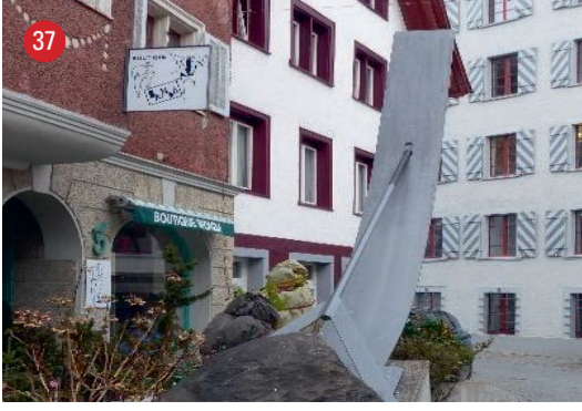
Kapellgasse 5 Saurer Bogen · René Moser · Schaffhausen