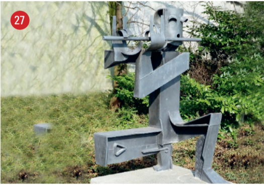
Bahnhofstrasse 49 Kniender Querflötist · Mädi Zünd · Balgach