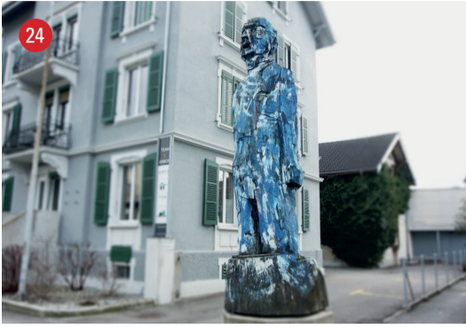
Sammlung ARTBON Brühlstrasse 5 Hans · Klaus Prior · Lugano