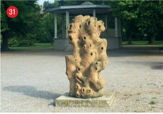
Jakob-Züllig-Park Wir verschwinden nie · Peter Kamm · St.Gallen