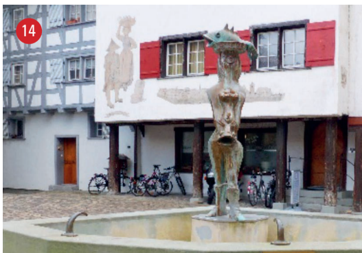
Fischmarktplatz Fischerin · Albert Lindi · Bern