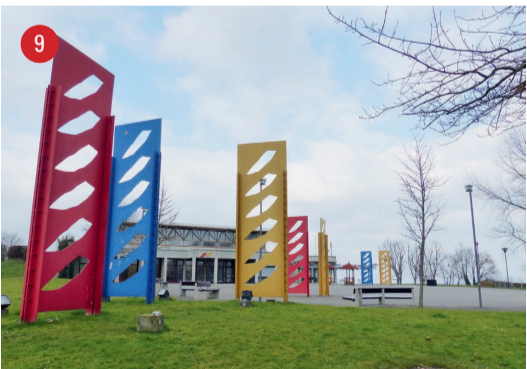
Wassergasse 14 Wind · Kurt Wolf · St.Gallen