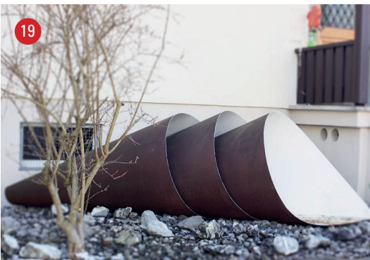
Rebenstrasse 51 Ineingesteckte Tüten · David Bürkler · St.Gallen