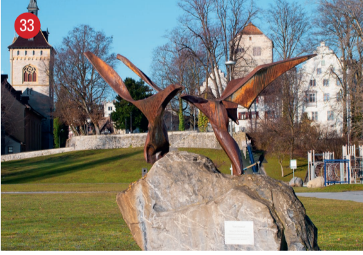
Seeuferanlage/Aussichtsplatz les oiseaux · Marc Moser · Arbon