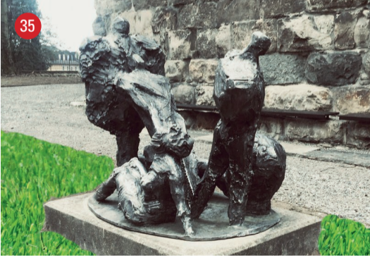
Schlossaufgang Gruppo Grande · Ivo Soldini · Ligornetto