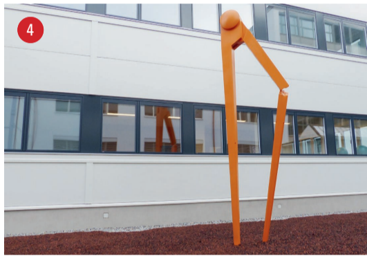
Zum See Zirkelbruch · Marc Moser · Arbon