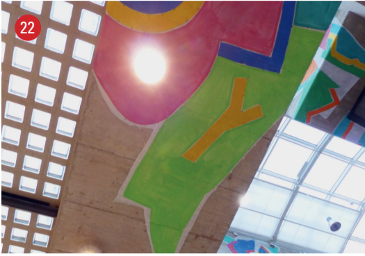
Novaseta Einkaufszentrum Deckenmalerei · Kurt Wolf · St.Gallen