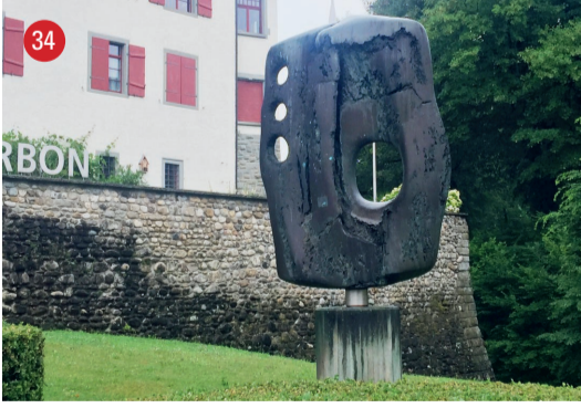
Schlossaufgang Drehbarer Durchblick · Max Oertli · St.Gallen