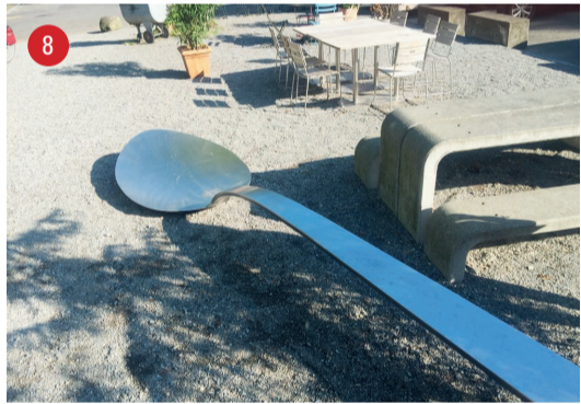
Hotel Wunderbar Der Löffel · Marc Moser · Arbon