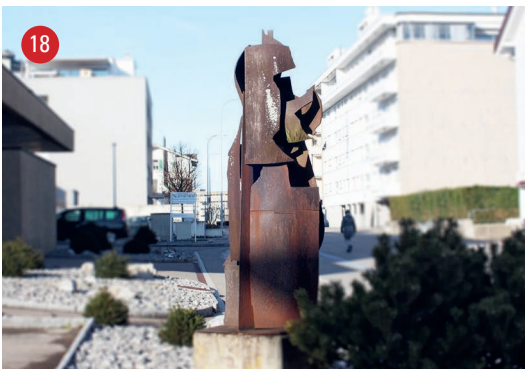
Friedenstrasse 7 Kein Titel · Oskar Wigglin · Muriaux