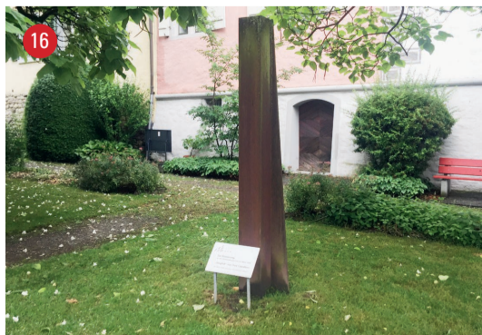
Rathausgasse 1 Vergleich · Toni Calzaferri · St. Margarethen